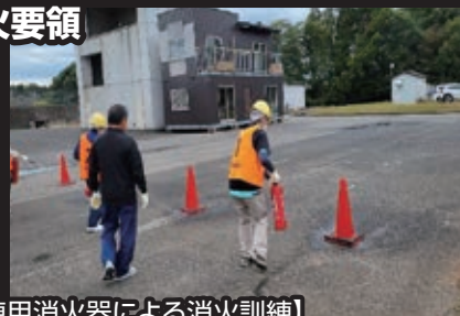
【訓練用消火器による消火訓練】

訓練用水消火器や訓練用屋内消火栓BOX等を使って、実際の操作要領を習得するほか、スプリンクラー設備のメカニズムを学びます。